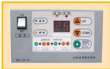
TK-1-KA (扉を開けた状態) デジタルボックス