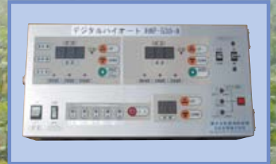
デジタルハイオート