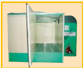
TK-1-KA (扉を開けた状態) デジタルボックス