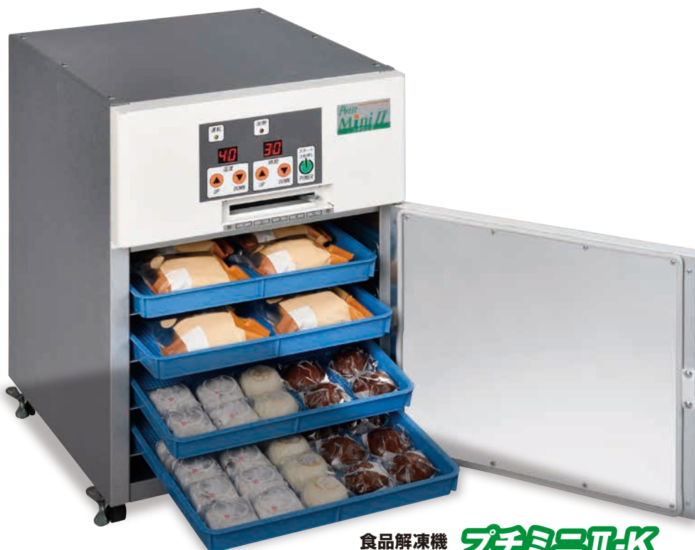
食品解凍機 プチミニII-K