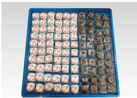
和菓子 饅頭・大福 ※600×600mmトレイ使用時