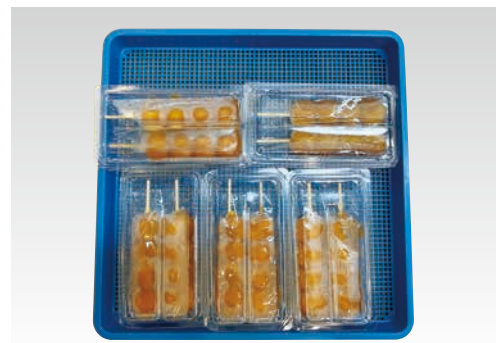
和菓子 みたらし団子 ※325×325mmトレイ使用時