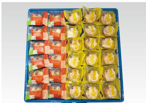
洋菓子 ブッセ ※600×600mmトレイ使用時